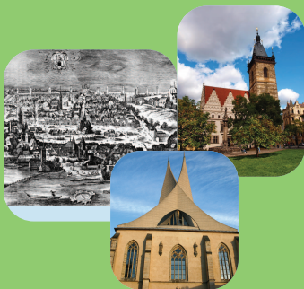
NOVÉ MĚSTO PRAŽSKÉ

Karlovi IV. velmi záleželo na prestiži království a vzdělanosti národa. Pražskou univerzitu po vzoru boloňské a pařížské založil listinou r. 1348. Byla jedinečná - šlo o první vysoké učení toho druhu na sever od Alp. Měla 4 fakulty: teologickou, svobodných umění, právnickou a medicínskou. Členy její akademické obce byli nejen domácí, ale i zahraniční studenti a učitelé ze středoevropských oblastí. Univerzita byla podřízena pražskému arcibiskupovi Arnoštovi z Pardubic a byla svobodným územím pro diskuzi. Vydáním Dekretu kutnohorského roku 1409 ztratila mezinárodní prestiž.